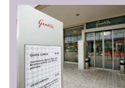
Sehr freundlich, das «Molto Gentile»

Viele Pläne und Projekte schwirren im Kopf des Michelin-Koch umher. Konkret ist die Ausweitung des «Gentile», welches überaus erfolgreich angelaufen ist, zu einem Beef-Club. Während tagsüber einfache Gerichte serviert werden, soll am Abend ein loungiger Beef-Club entstehen, in dem beste Steaks und Beef-Gerichte serviert werden. Lieferant ist unter anderem der Yellow Frontmann